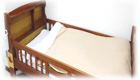
③かけ布団・毛布を敷いてシーツを折り返す