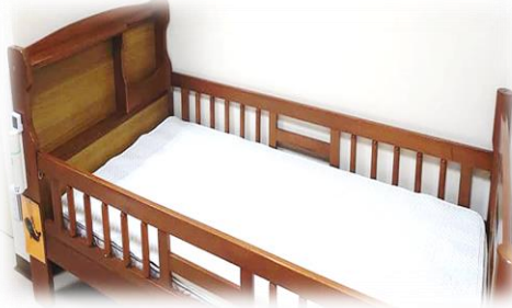
②シーツを2枚重ねて敷く