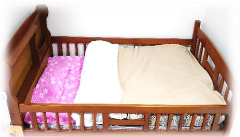
⑥バスタオルをまくらが隠れるように敷く