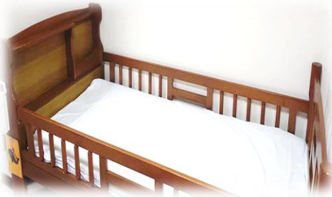
①ベッドパットを敷く

メインホール棟の「シーツ置き場」から「シーツ2枚」と「まくらカバー1枚」、「まくら用ビニール袋1枚」を持っていく