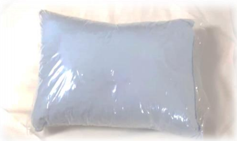
④まくらをビニール袋へ入れる