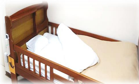
⑤まくらカバーへまくらを入れる